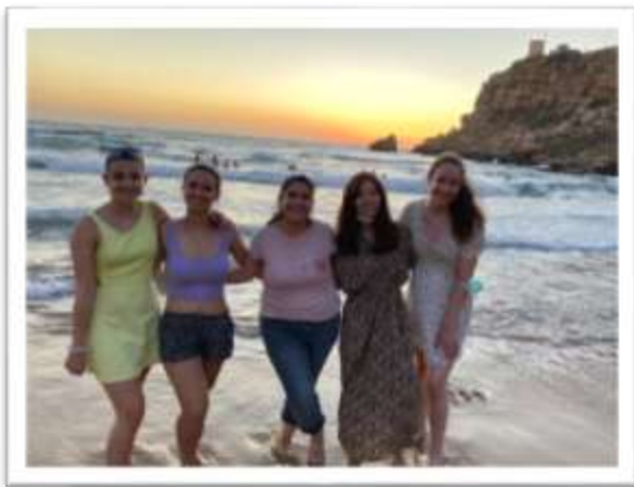
図 3 Golden Bay にて 夕日がとても綺麗なビーチ

一番印象に残っているのは、みんなで集まり、それぞれの国の料理を振る舞う International Night を開催したことである。食べる前に料理の説明を聞くのも楽しかった。7 月の終わりと 8 月の終わりの 2 回開催したのだが、IAESTE インターン生の入れ替えなどで、全く違うメンバーになったので、2 回とも違う料理や雰囲気の会になり、どちらもとても楽しかった。