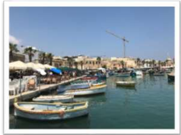
図 6 Marsaxlokk の Fish Market 毎週日曜に開かれるマーケット