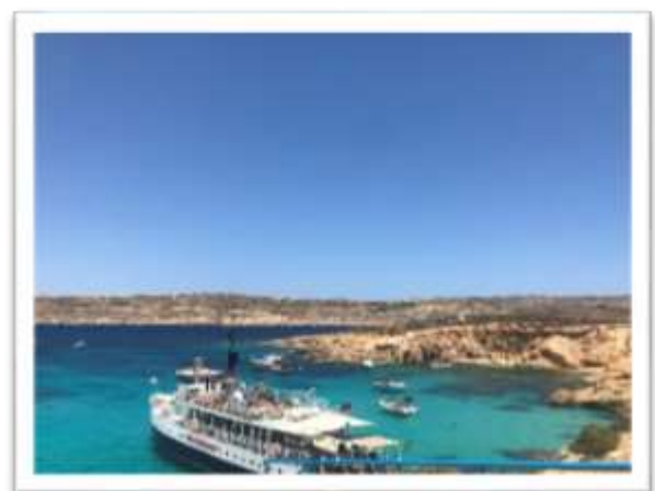
図 4 Comino island マルタ島からフェリーで遊びに行った