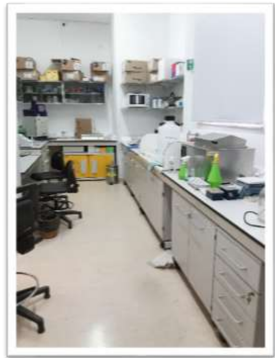
図2 ウエスタンブロット・電気泳動を行った部屋