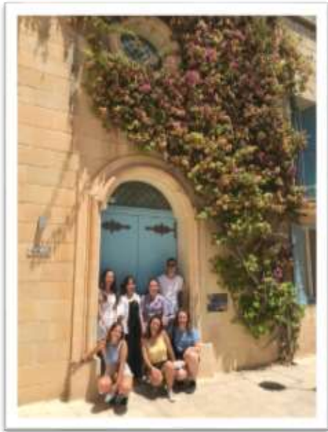
図 5 Mdina にて 静かな町で古い町並みを楽しんだ